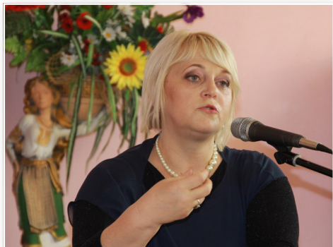
Марія МОРОЗЕНКО, українська письменниця, літературний редактор

Народилася 15 березня 1969 року в селі Малині Млинівського району Рівненської області.