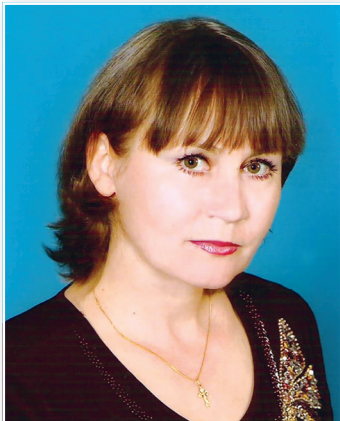
Леся ПРОНЬ, українська поетеса і прозаїк

Народилася 24 липня 1958 р. у с. Михальче Городенківського району Івано-Франківської області. Працювала в театрі сатиричних мініатюр, в Івано-Франківському театрі ляльок ім. М. Підгірянки.